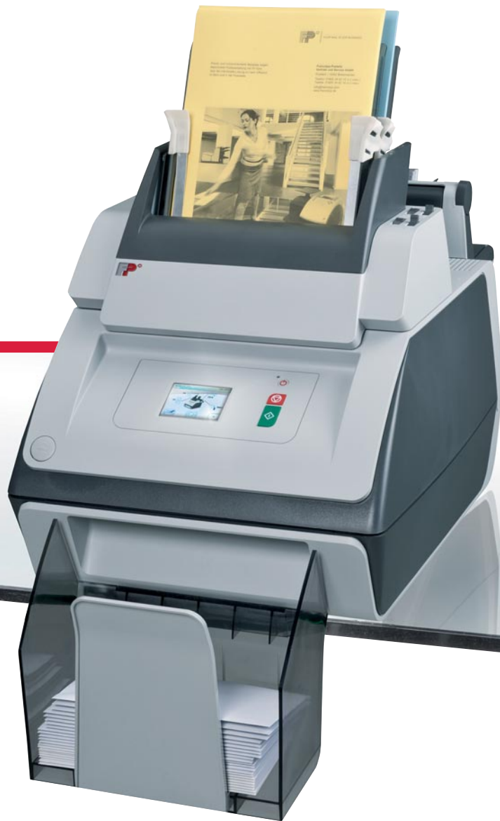
Tischkuvertiersystem FPI 600