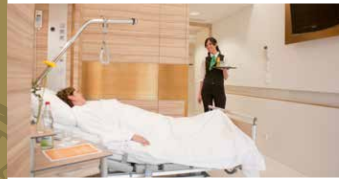
Moderne Ein- und Zweibettzimmer mit umfangreichem Stauraum und eigenem Safe