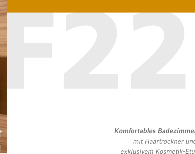
Komfortables Badezimmer mit Haartrockner und exklusivem Kosmetik-Etui