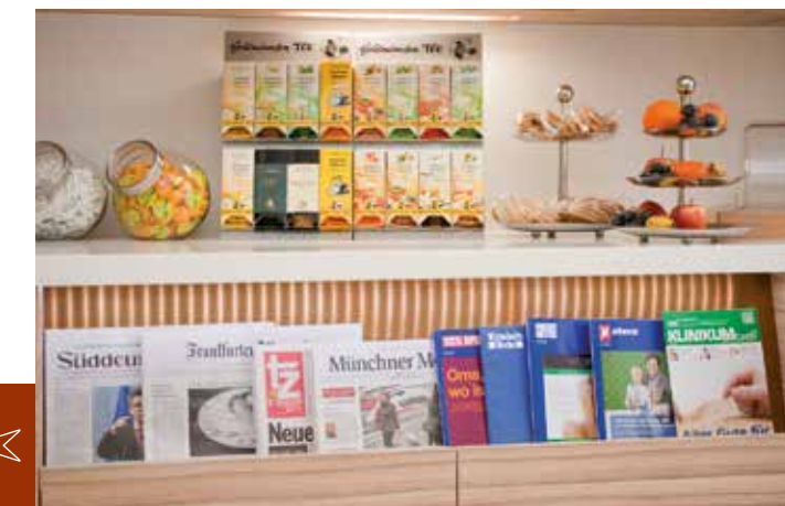
Gut informiert Große Auswahl an tagesaktueller Presse und Zeitschriften