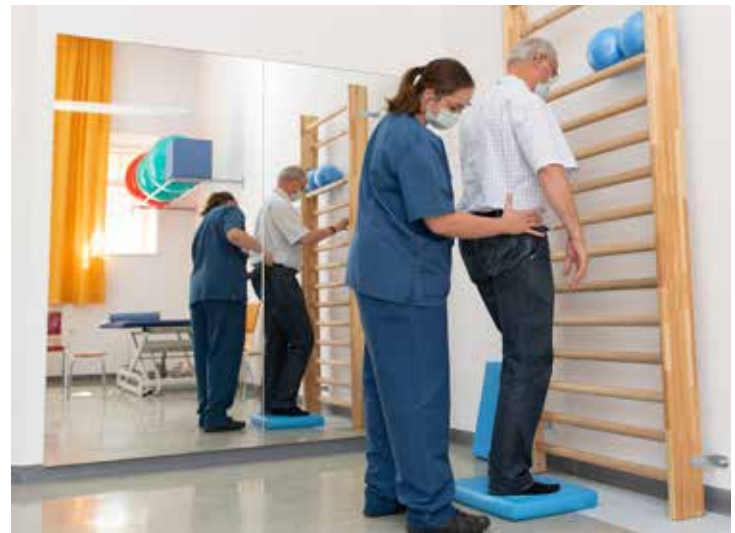
Patient in der Physiotherapie