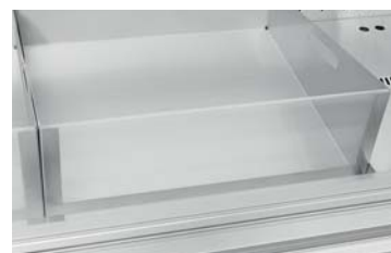
Чаша для раков