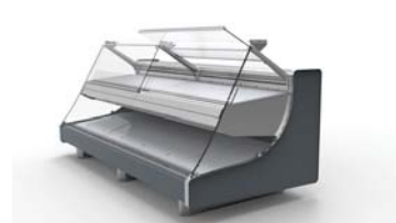
Перемещение стекла назад

Инновационный механизм, позволяющий трансформировать витрину из системы обслуживания продавцом в витрину самообслуживания.