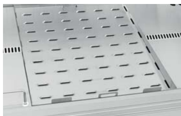
Решетка для чешуйчатого льда