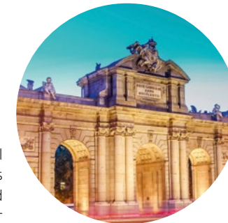
Puerta de Alcalá in Madrid