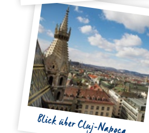
Blick über Cluj-Napoca