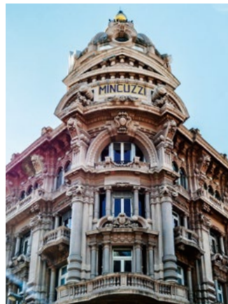
Palazzo Mincuzzi in Bari

Kunstinteressierte kommen im Monastero Santa Scolastica (archäologisches Museum), in einem ehemaligen Kloster aus dem 12. Jh. gelegen, und in der Pinacoteca Provinciale Corrado Giaquinto (Pinakothek) mit einer umfangreichen Gemäldesammlung der Region, bestehend aus Werken aus dem 15.-19. Jahrhundert, voll auf ihre Kosten.