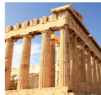
Parthenon in Athen

Die europäische Metropole ist sowohl Spaniens Hauptstadt, als auch das geographische, ökonomische und kulturelle Zentrum des Landes. Für Modeverrückte lässt Madrid keine Wünsche offen, Kunstinteressierte kommen in den vielen Galerien ins Staunen und Fans von mediterraner Küche finden in der Stadt ein Paradies für Feinschmecker.