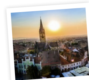
Sonnenaufgang in Sibiu

Der reiche Waldbestand und die alten Burgen untermauern die berühmteste aller Legenden um den Grafen Dracula, der hier gelebt haben soll.