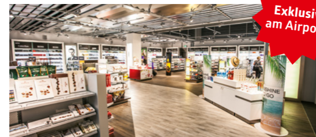
Vielzahl an Düften