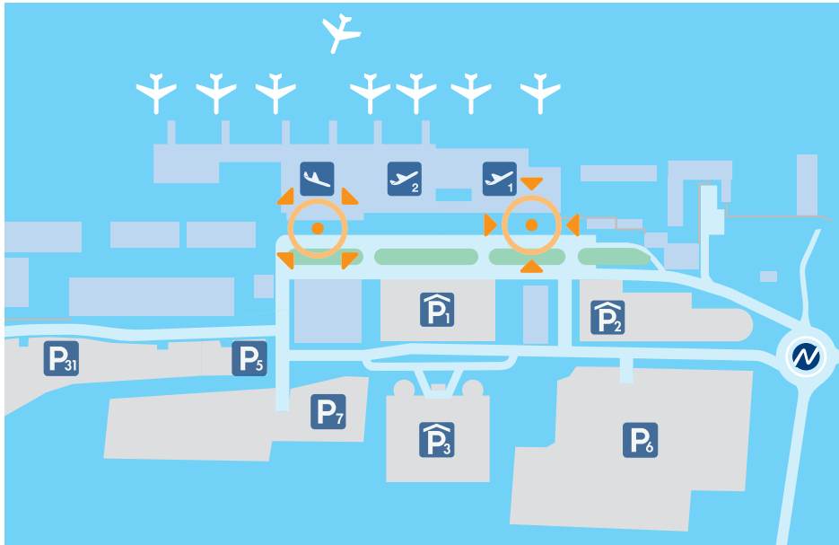
Flughafen-Lageplan inkl. Kennzeichnung der Werbeflächen