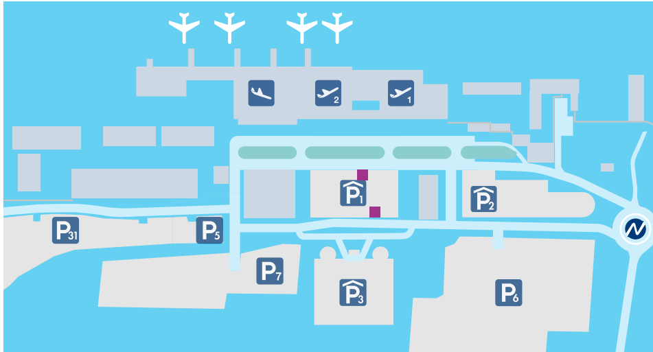
Flughafen-Lageplan inkl. ■ Standorte der Werbeflächen