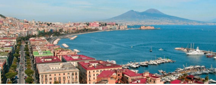
Panorama von Neapel mit dem Vesuv