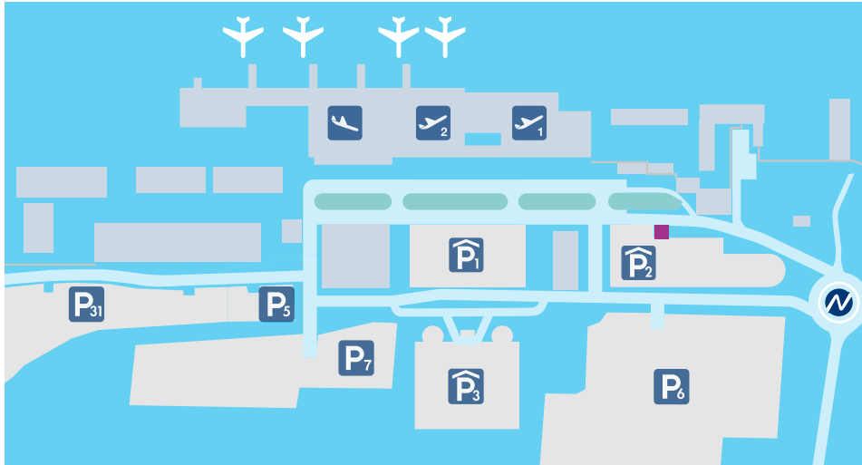
Flughafen-Lageplan inkl. ■ Standorte der Werbeflächen