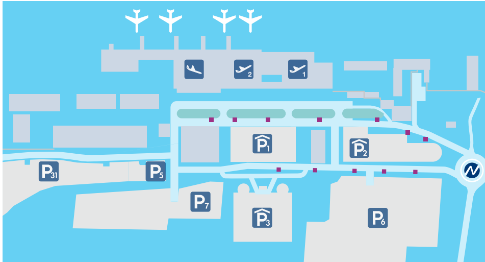
Flughafen-Lageplan inkl. ■ Standorte der Werbeflächen