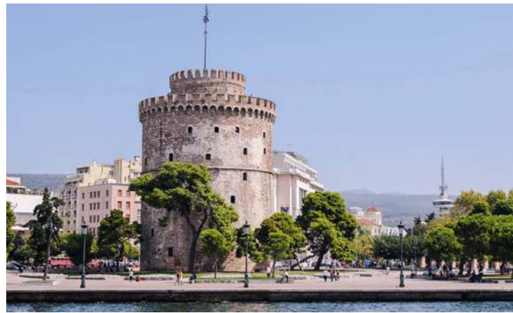
Der weiße Turm von Thessaloniki