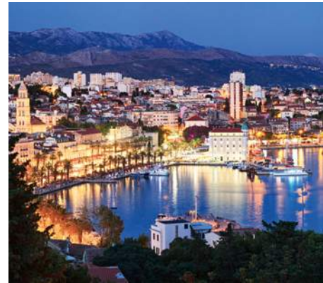
Split bei Nacht

Dann sind Sie in Split genau richtig! Feierwütige können sich in zahlreichen Bars und Clubs ins Nachtleben stürzen. Die Uferpromenade Riva ist für den Start in den Abend bestens geeignet.