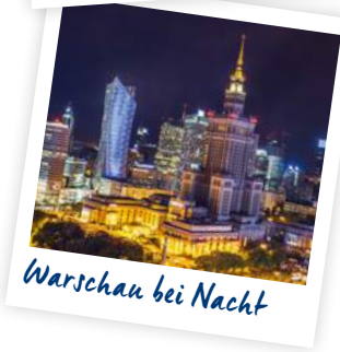
Warschau bei Nacht