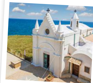
Kirche am Capo Colonna

Die Hauptstadt der gleichnamigen Region Crotona befindet sich im Süden Italiens, in Kalabrien. Der Legende nach wurde sie bereits während der Magna Graecia um 710 v. Chr. gegründet und hatte damals noch den Namen Kroton.