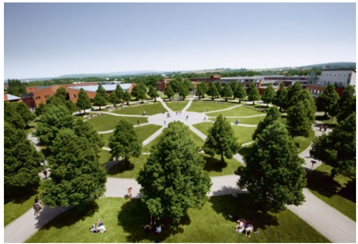
Die Vorteile einer Campus-Uni sind kleine Studiengruppen und die Möglichkeit des Austauschs mit den Dozentinnen und Dozenten.