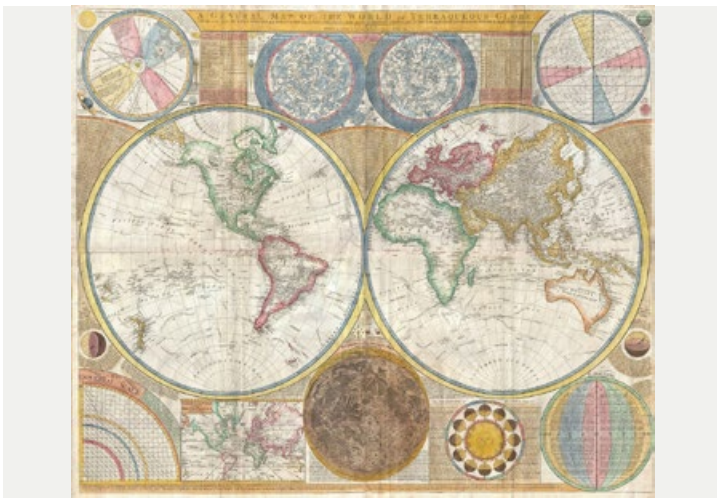
Neue Welten entdecken. Der BA Geschichte bietet neben vielen anderen Themen kritische Perspektiven auf die "Europäische Expansion" und ihre Wirkungen bis heute. (Wandkarte von Samuel Dunn, 1794)