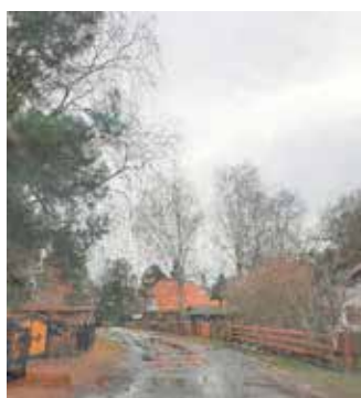
Rosenstraße vor Baudurchführung