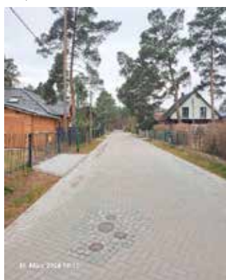
Goldregenstraße (Blumenstr. – Alte Hauptstr.) nach Baudurchführung