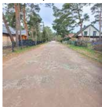
Goldregenstraße (Blumenstr. – Alte Hauptstr.) vor Baudurchführung