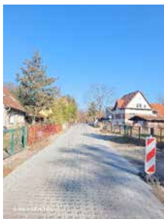
Am Todnitzsee nach Baudurchführung