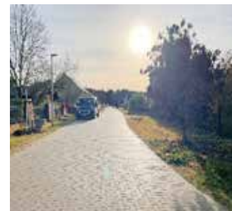
Skabyer Straße (Friedhofsweg – Skabyer Str.) nach Baudurchführung

Steigende Baupreise führen verstärkt zu einem Umdenken. Immer mehr Anlieger*innen setzen auf die Kostenvorteile des privat finanzierten Straßenbaus und entscheiden sich für diese wirtschaftlich attraktivere Variante. In 2025 wurden bereits zwei weitere Erschließungsverträge geschlossen, deren Baudurchführung in 2026 beginnen kann: