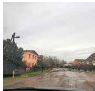
Skabyer Straße (Friedhofsweg – Skabyer Str.) vor Baudurchführung