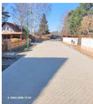
Rosenstraße nach Baudurchführung

Als Anlage zum Sachstandsbericht wird die „Liste über die Rang- und Reihenfolge der Straßenbaumaßnahmen“ stets aktualisiert. Um auf einen aktuellen Planungsstand abstellen zu können, wurde der Beschluss der Stadtverordnetenversammlung zum Haushaltsplan 2026/2027 vom 23.03.2026 bei der diesjährigen Bestimmung der Rang- und Reihenfolge der Maßnahmen aus dem sog. Sandstraßenprogramm berücksichtigt. Aus diesem Grunde stellt die „Liste über die Rang- und Reihenfolge der Straßenbaumaßnahmen“ zum Sachstandsbericht auf den 31.03.2026 ab.