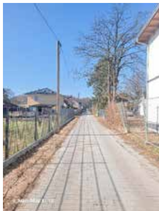
Dostweg nach Baudurchführung