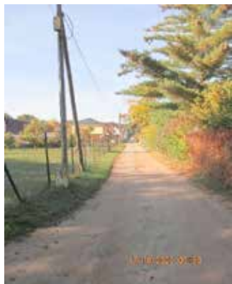
Dostweg vor Baudurchführung