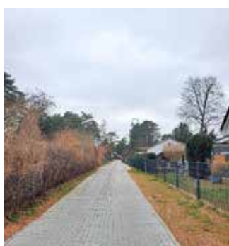
Goldregenstraße (Alte Hauptstr. bis Grünstr.) nach Baudurchführung