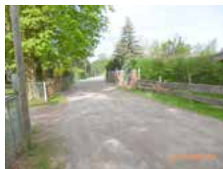
Krumme Straße vor Baudurchführung

Kostenbeteiligung pro Quadratmeter: Abrechnung erst in 2026 möglich