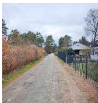
Goldregenstraße (Alte Hauptstr. bis Grünstr.) vor Baudurchführung