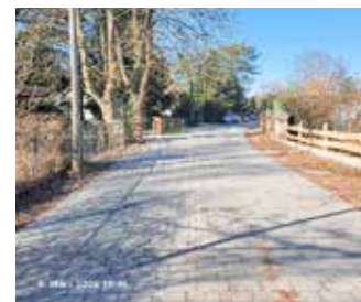
Krumme Straße nach Baudurchführung