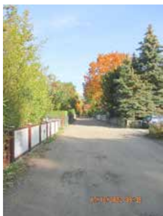
Am Todnitzsee vor Baudurchführung