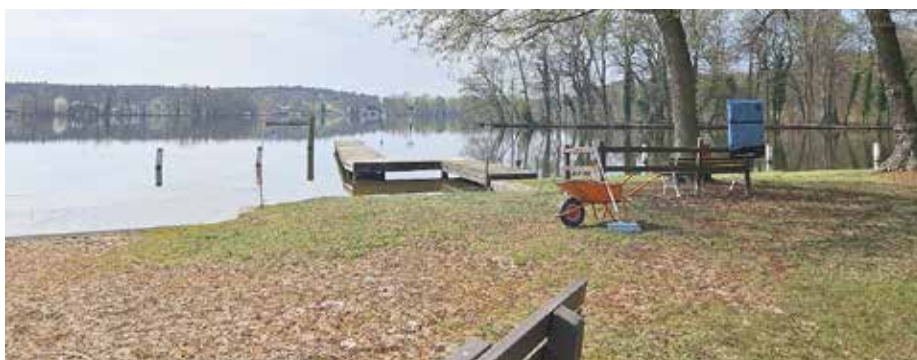
Für die Badesaison wird im Strandbad jetzt alles vorbereitet.

Da die Schließzeit über den Winter dazu genutzt wurde, den dringend notwendigen Austausch der Wasserleitungen vorzunehmen, muten Teile der großen Liegewiese derzeit noch wie eine unfreiwillige neue Buddelkiste an. Doch spätestens nach dem Drachenbootcup