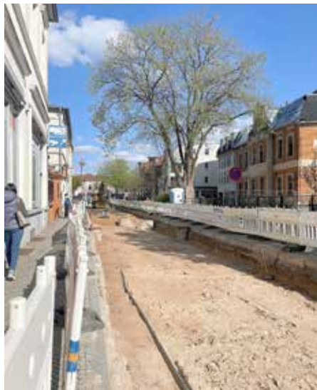
Im ersten Bauabschnitt wurde das Pflaster bereits abtransportiert.

werden bei noch genau zu terminierenden Anliegerversammlungen entsprechende Informationen über den genauen Ablauf der Bauarbeiten erhalten.