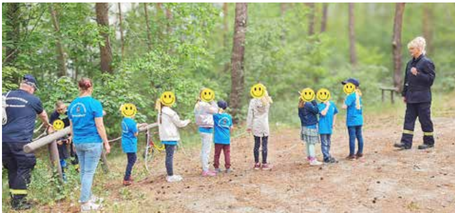
Spielerisch lernen die Kinder beim Ausbildungstag der Jugendfeuerwehren viele neue Dinge.

Am Samstag, 9. Mai 2026, veranstalten die Kinder- und Jugendfeuerwehren der Stadt Königs Wusterhausen ihren jährlichen Ausbildungstag, diesmal im Ortsteil Kablow. Die Veranstaltung auf dem Dorfanger findet von 7.00 Uhr bis 17.00 Uhr statt. Erwartet werden rund 77 Mädchen und Jungen im Alter zwischen sechs und 16 Jahren.