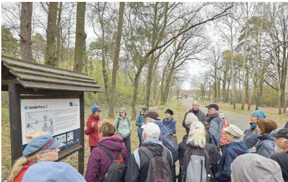
Der Funkerberg war das Ziel der diesjährigen Wanderung zur Saisonöffnung.