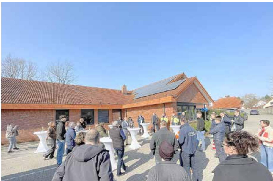
Die EWE Netz GmbH hat feierlich ihren neuen Verwaltungsstandort in Königs Wusterhausen eingeweiht.

Insgesamt 40 Menschen arbeiten am neuen Verwaltungsstandort. Ihnen stehen 25 moderne Wechselarbeitsplätze zur Verfügung. Die EWE Netz GmbH reagiert damit auf die seit der Pandemie veränderten Arbeitsweisen. Entstanden sind offene Raumstrukturen, um den gegenseitigen Austausch und die Zusammenarbeit zu fördern. Bei der Modernisierung des Bestandsgebäudes wurde großer Wert auf Energieeffizienz und erneuerbare Energien gelegt. Dazu gehören beispielsweise Photovoltaik, Wärmepumpe und Ladeinfrastruktur für E-Autos. Bürgermeisterin Wiczorek begrüßt die Ansiedlung: „Wir freuen uns sehr, dass die EWE Netz GmbH ihren neuen Verwaltungsstandort in Königs Wusterhausen eingerichtet hat. Das stärkt unseren Wirtschaftsstandort.“