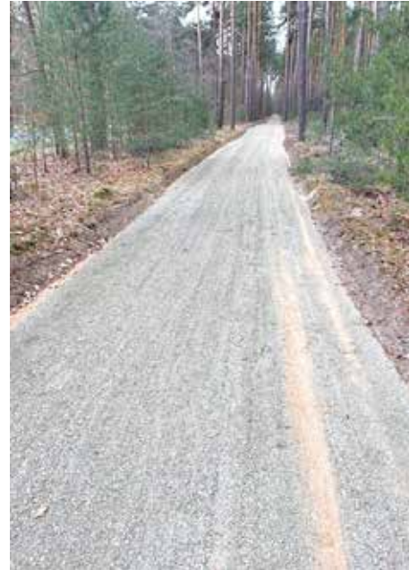
Der Brandschutzstreifen zwischen Senzig und Bindow wurde mit Schotter stabilisiert und kann jetzt von Radfahrer*innen sicher befahren werden.

leuchtung installiert werden. Auch dort sind die Lichtpunkte mit dem „Clever-Light“ ausgestattet und werden entsprechend heller, wenn ein Radfahrer auf dem Weg unterwegs ist.