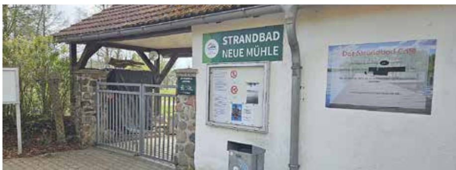
Am 15. Mai beginnt im Strandbad Neue Mühle die Badesaison.

Neben einer moderaten Anhebung der Eintrittspreise wird es zukünftig auch im Kassenbereich eine Neuerung geben. Die Möglichkeit der bargeldlosen Bezahlung mit Karte wird derzeit vorbereitet. Außerdem ist personeller Zuwachs geplant: Nachdem im vergangenen Jahr sogar mit eingeschränkten Öffnungszeiten auf den Personalmangel reagiert werden musste, soll ab dem Sommer voraussichtlich ein neuer Kollege das Team der Schwimmmeister verstärken. Darüber hinaus sollen wie in den vorangegangenen Jahren auch mehrere Saisonarbeitskräfte beschäftigt werden. Weitere Informationen zum Strandbad, den genauen Eintrittspreisen und den Öffnungszeiten erhalten Sie unter https://www.koenigs-wusterhausen.de/strandbad-neue-muehle