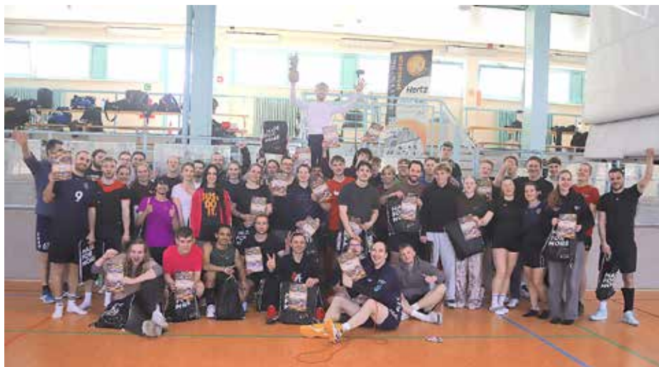
Teilnehmer des „Oster-Mix-Up-Turniers“