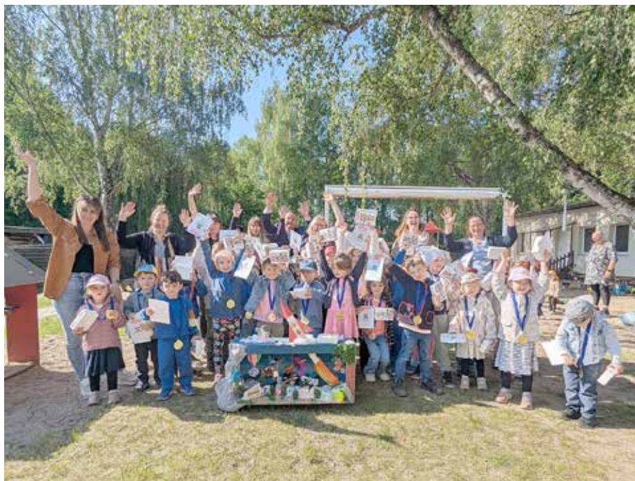
Kinder der Kita Kleine Pfefferkörner aus Wernsdorf freuen sich über den 1. Platz im Ideenwettbewerb „Unser Traum vom Fliegen“

Als drittplatzierte Kita überzeugte die „Kita am Markt“ aus Wildau mit ihrem Kunstwerk „Heißluftballon – Ein Flugtraum von 22 kleinen Wölfen“. Im Korb eines aus Zeitungsschnipseln, Tapeutenkleister, Weidenruten und Farbe gefertigten Heißluftballons sitzen 22 kleine Wölfe als Rudel dicht beieinander und steigen hinauf in den Himmel. Insgesamt nahmen 13 Kindertagesstätten am Wettbewerb teil.