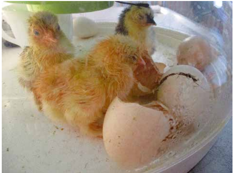
Nach dem Schlüpfen müssen die Küken trocknen.