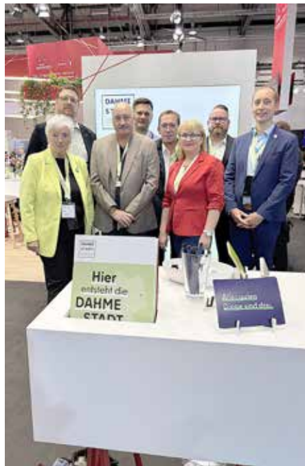
Stadtverordnete konnten sich auf Einladung des BDLI über die Luftfahrtunternehmen der Region informieren.

Auch an den Besuchertagen – Samstag und Sonntag – fanden viele gute Gespräche mit interessierten Menschen aus nah und fern statt. Vielen Dank an den BDLI und die Messe Berlin, dass wir wieder dabei sein konnten.