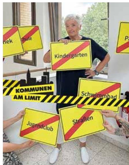
Kommunen am Limit – denn vor Ort wird sichtbar, was auf dem Spiel steht.