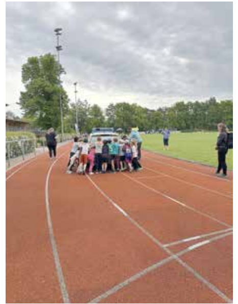
Großen Spaß machte den Kitakindern das Polizeiautoschießen.

Hintergrund: Die Kita-Olympiade „Immer in Bewegung mit Fritzi“ wird von der Brandenburgischen Sportjugend organisiert und unterstützt. Ziel der landesweiten Initiative ist es, Sport und Bewegung stärker im Alltag der Kinder zu verankern und gleichzeitig auf die Bedeutung von Bewegung für eine gesunde Entwicklung aufmerksam zu machen. In verschiedenen spielerischen Übungen und Wettbewerben können die Kinder ihre motorischen Fähigkeiten testen und weiterentwickeln. Der Wettbewerb hat sich mittlerweile zur größ-