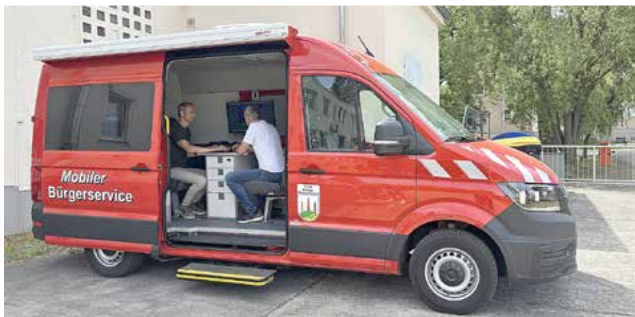
In diesem roten Auto bietet die Stadtverwaltung ab Ende Juni regelmäßig in den Ortsteilen einen mobilen Bürgerservice an.

Hinweis: Die Bezahlung beim mobilen Bürgerservice ist nur mit Karten (EC-/Kreditkarten) möglich, Bargeldzahlungen werden nur im Bürgerservice in der Schlossstraße 3 akzeptiert.