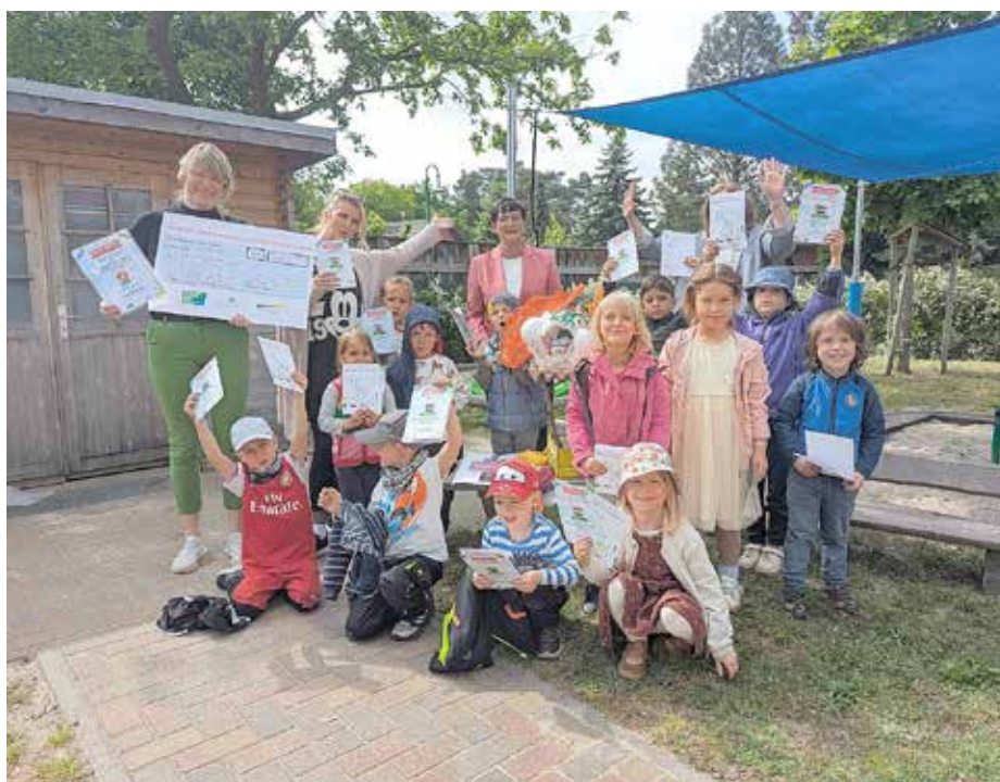
„Unser Leuchtkäfer“ heißt das Kunstwerk der Kita „Steinbergwichtel“ aus Zeesen, die den zweiten Platz erreichten.

Text: Wirtschaftsförderung Dahme-Spreewald