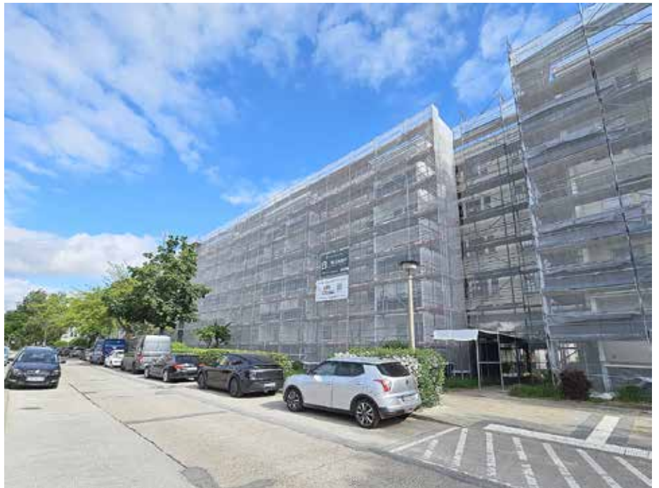
Die WoBauGe saniert derzeit dieses Wohngebäude, um den Wohnkomfort zu verbessern und den Energieverbrauch zu reduzieren.

lich Anfang November 2026 abgeschlossen sein. Die Kosten der Modernisierung werden entsprechend den gesetzlichen Regelungen nur anteilig auf die Mieter umgelegt und zwar nur, soweit sie unmittelbar mit der Modernisierung zusammenhängen.