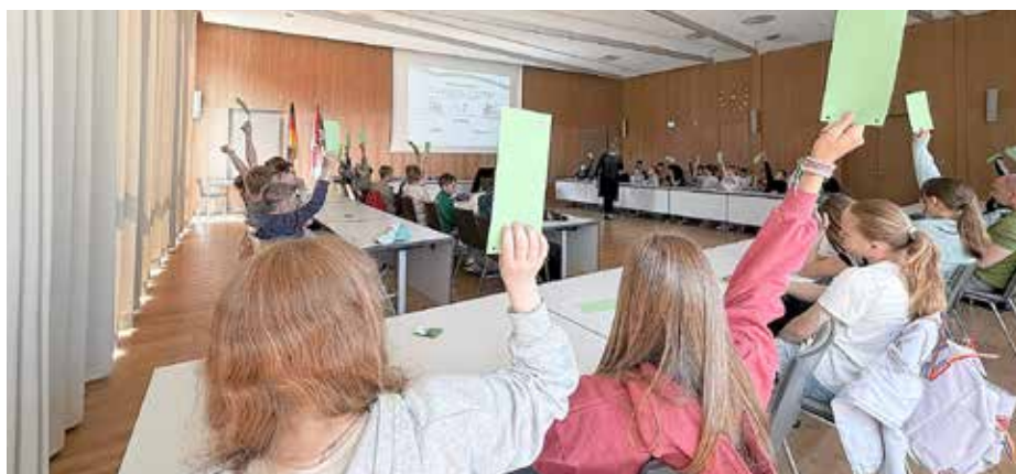
Grundschüler stimmten beim Tag der Demokratie im Ratssaal ab.

Ebenso interessierte die Schülerinnen und Schüler, welche Herausforderungen Königs Wusterhausen derzeit bewältigen muss. Die Bürgermeisterin machte deutlich, dass die finanziellen Mittel der Kommunen vielerorts nicht ausreichen, um notwendige Investitionen in Verkehr, Infrastruktur, Schulen und Kitas umzusetzen. Gleichzeitig bringe das stetige Wachstum der