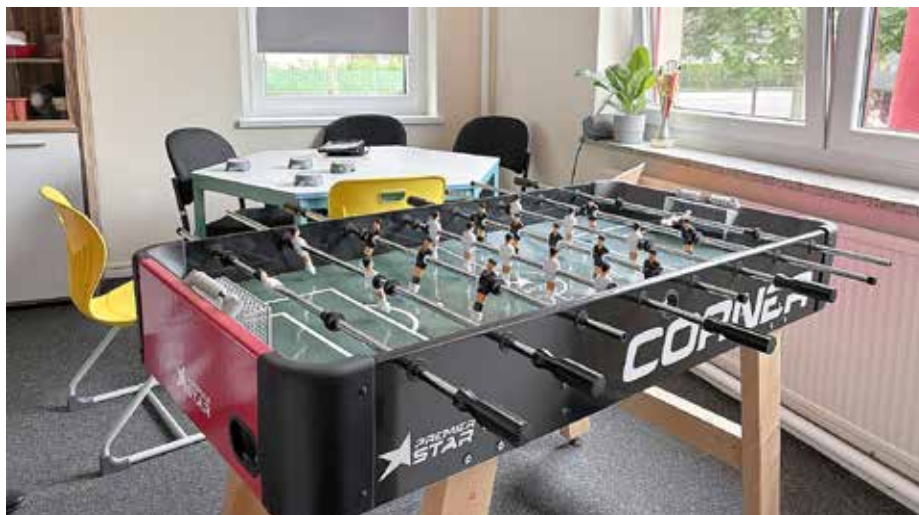
Die Kinder und Jugendlichen in Zeesen haben seit Juni zwei Räume, in denen sie sich treffen können.

Die große Ideenwand im Flur ist noch leer. Toni und Julian – die beiden Jugendsozialarbeiter*innen des KSB – sind zuversichtlich, dass dort in den nächsten Wochen viele Vorschläge notiert werden. Am Eröffnungstag nutzten viele Jugendliche die Möglichkeit, um die neuen Räume kennenzulernen. Bisher fand die Jugendsozialarbeit in Zeesen ausschließlich mobil statt. Julian und Toni trafen die Kinder und Jugendlichen im Alter zwischen zehn und 18 Jahren draußen – am Strand, auf dem Bolzplatz oder an anderen Orten. Unabhängig vom Wetter gibt es ab sofort immer mittwochs und donnerstags zwischen 14 und 18.30 Uhr das Angebot im Jugendraum etwas zu unternehmen. Dort gibt es einen Tischkicker, ein Sofa und einen