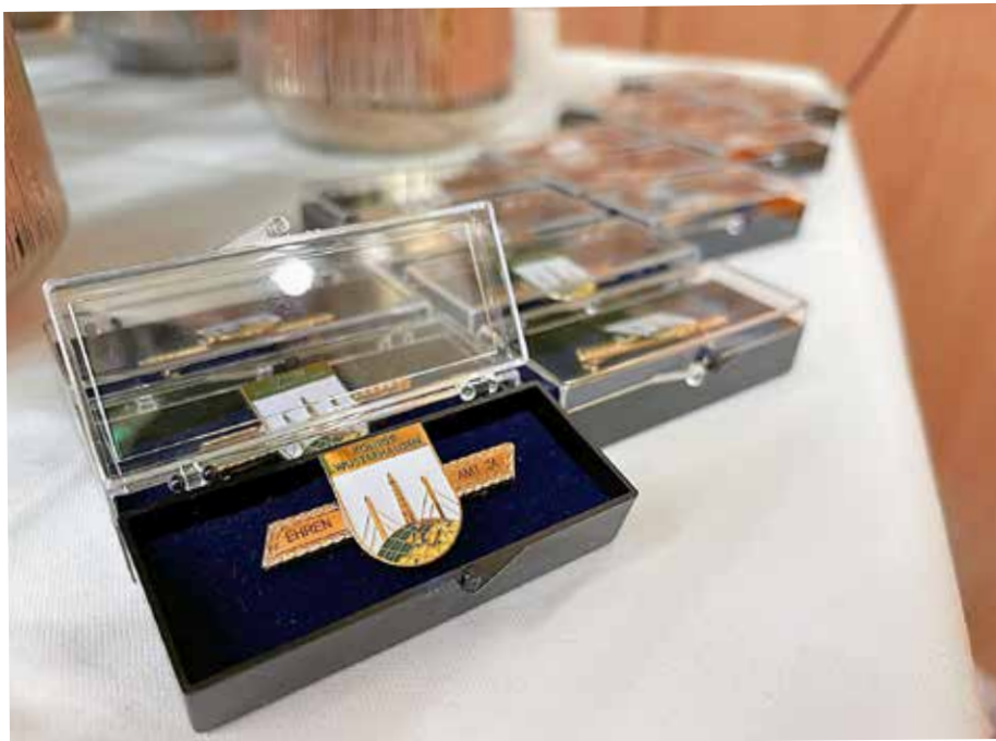
Die Ehrenamtsnadel der Stadt Königs Wusterhausen wird im Dezember verliehen.

https://formulare.dikom-bb.de:443/metaform/Form-Solutions/sid/assistant/662a4eca32248b5c-40d7ee73