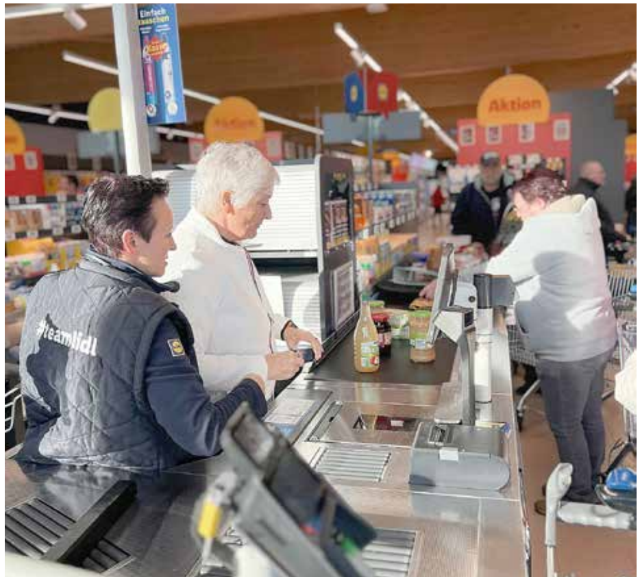
Zur Eröffnung setzte sich die Bürgermeisterin selbst für etwa 20 Minuten an die Kasse.

aufgestockt. Die Spende fließt in den weiteren Ausbau des Außengeländes am Bürgerhaus in der Friedensstraße.