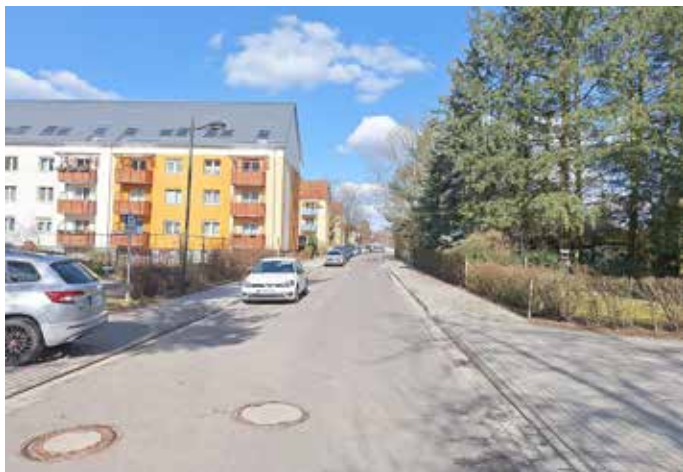
Der erste Bauabschnitt der Fontanestraße ist fertiggestellt.

Investitionen für diesen ersten Bauabschnitt auf rund 1,4 Millionen Euro. Geplant ist noch in diesem Jahr mit dem zweiten Bauabschnitt der Sanierungsmaßnahme zu beginnen. Dies betrifft die Fontanestraße zwischen Cottbuser und Erich Kästner Straße. Sobald der Zeitplan klar ist, wird es im Vorfeld entsprechende Anliegerversammlungen und Informationsschreiben geben.