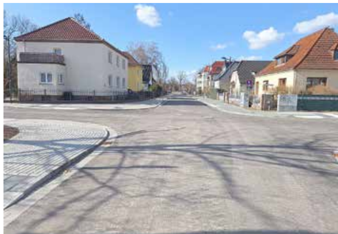
Auch die Erich Kästner Straße ist jetzt wieder durchgängig befahrbar.