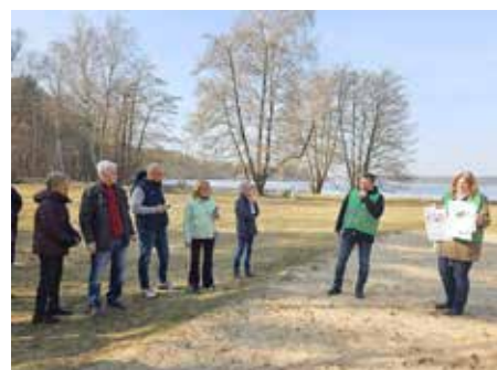
Die Badestelle Krossinsee war eine Anlaufstelle beim Ortsteilspaziergang.