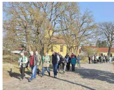
Der vierte Ortsteilspaziergang mit der Bürgermeisterin fand in Wernsdorf statt. Rund 50 Bürger*innen waren der Einladung gefolgt.