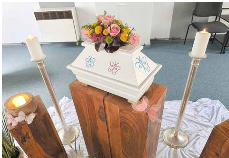
Die Trauerfeier für die Schmetterlingskinder findet zweimal im Jahr statt.

Die Stadt Königs Wusterhausen und das Klinikum Dahme-Spreewald danken herzlichst für Ihre Unterstützung.