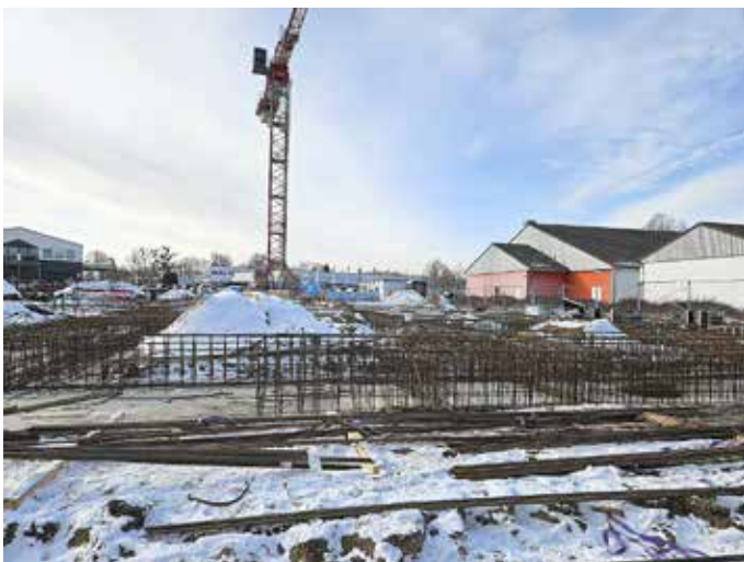
In Zeesen entsteht ein moderner Einkaufsmarkt mit einem Sportplatz auf dem Dach.

Bei dem Zeesener Supermarkt mit Sportdach handelt es sich um ein Rewe Green Building. Die Bauform sorgt für Energieeinsparungen von bis zu 50 Prozent gegenüber konventionellen Gewerbebauten. Eine Photovoltaikanlage auf dem Dach liefert bis zu 90.000 Kilowattstunden Strom pro Jahr für den Supermarkt, den restlichen Bedarf deckt REWE mit zertifiziertem Grünstrom ab. Wärmepumpen und Wärmerückgewinnung aus den Kühlanlagen übernehmen die Beheizung. Das optische Herzstück der rund 1.800 Quadratmeter großen Markthalle mit Glasdach wird – neben der Sportanlage – ein vier Meter hoher, schwebender Garten sein. Um ihn herum gruppieren sich lange Frischetheken, Obst und Gemüse sowie eine Sushi-Bar. Für die im Eingangsbereich geplante Bäckerei konnte die traditionsreiche Familienbäckerei Heider aus Königs Wusterhausen gewonnen werden. Nach der Grundsteinlegung sollen die Bauarbeiten in diesem Jahr zügig voran gehen. Die Eröffnung des neuen Supermarktes ist bereits für das Frühjahr 2027 geplant.