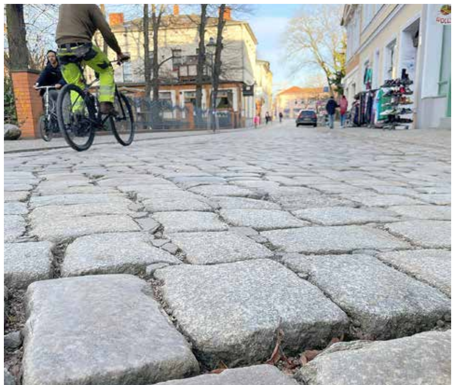
Das Kopfsteinpflaster auf der Bahnhofstraße in Königs Wusterhausen wird voraussichtlich bis zum Jahresende durch ein besser begehbares Pflaster ersetzt.

Ende Februar erfolgte die Information der Anlieger*innen und Gewerbetreibenden im Bereich des ersten Bauabschnitts und die Sanierungs- und Pflasterarbeiten können jetzt beginnen. Entsprechend dem Baufortschritt werden in den nächsten Monaten auch die Anlieger*innen und Gewerbetreibenden der beiden anderen Bauabschnitte informiert.