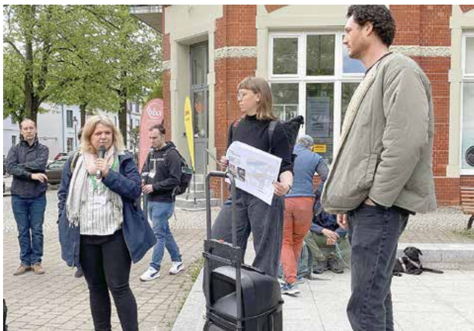
Mehr als nur ein Standort für den Wochenmarkt: Der Brunnenplatz soll aufgewertet werden.