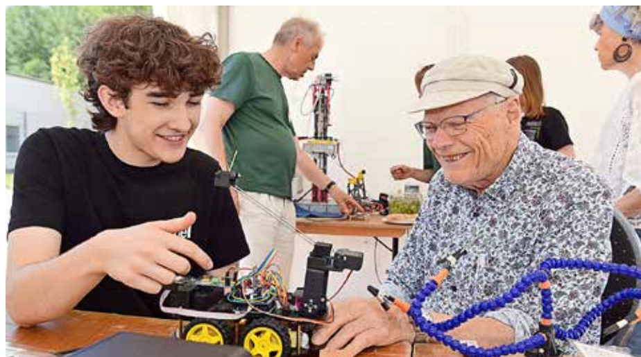
Bei der Innovationsmeile in Wildau gibt es wie vor zwei Jahren viel zu entdecken.