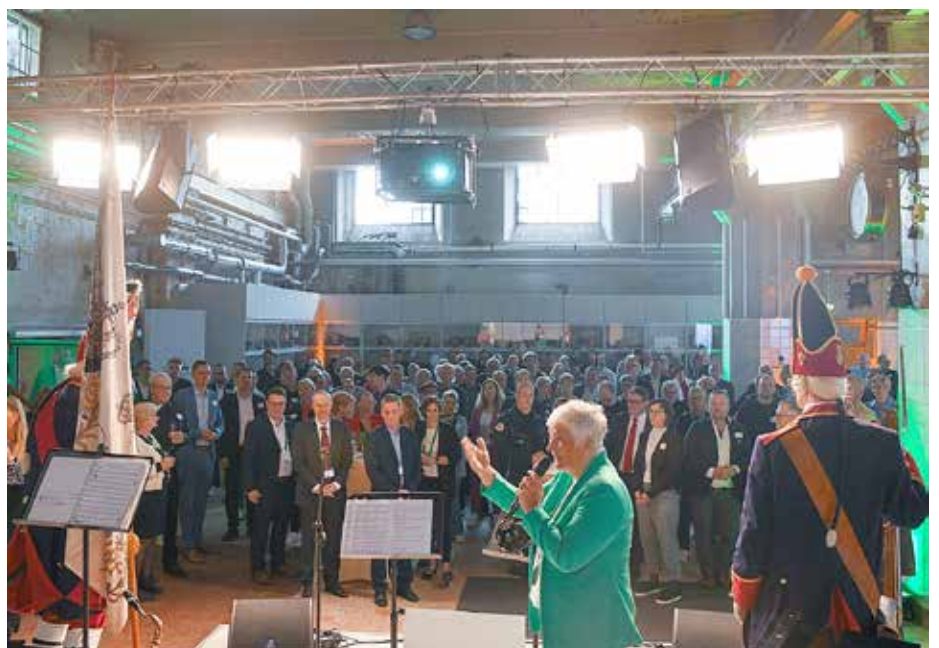
Bürgermeisterin Michaela Wiezorek begrüßt die Gäste beim Stadtempfang im Maschinensaal auf dem Funckerberg.

Als positives Beispiel für bereits funktionierende Netzwerke wurde „Sport in KW“ genannt, wo Vereine und ehrenamtliches Engagement aktiv unterstützt werden. Der Stadtempfang setzte damit ein Zeichen für Zusammenhalt, Toleranz, Vielfalt und den Mut, gemeinsam nach vorne zu denken.