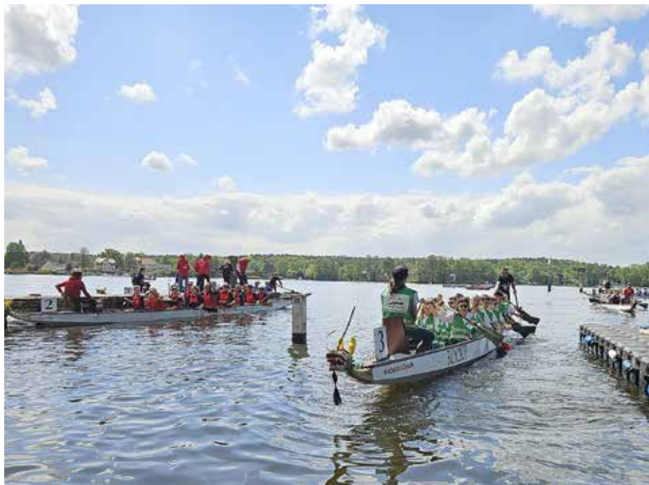
Als „Rathausexpress“ stellten sich Mitarbeiter*innen der Verwaltung der Herausforderung.

So war der 24. Drachenbootcup im Strandbad Neue Mühle wieder ein erlebnisreicher Tag für Wettkämpfer und Zuschauer, wie immer bestens organisiert durch den WSV Königs Wusterhausen und nur möglich durch das ehrenamtliche Engagement vieler helfender Hände und großzügiger Sponsoren. Vielen Dank hierfür – wir freuen uns schon auf das nächste Jahr.