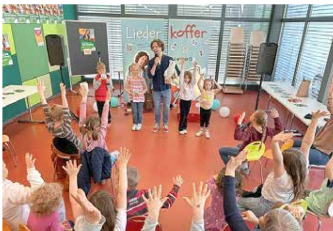
Im Bürgertreff Fontaneplatz gibt es an jedem letzten Sonntag im Monat ein abwechslungsreiches Mitmachprogramm für Kinder.

Der Sonntagstreff ist eine städtische Veranstaltungsreihe, die immer am letzten Sonntag im Monat im Bürgertreff Fontaneplatz stattfindet.