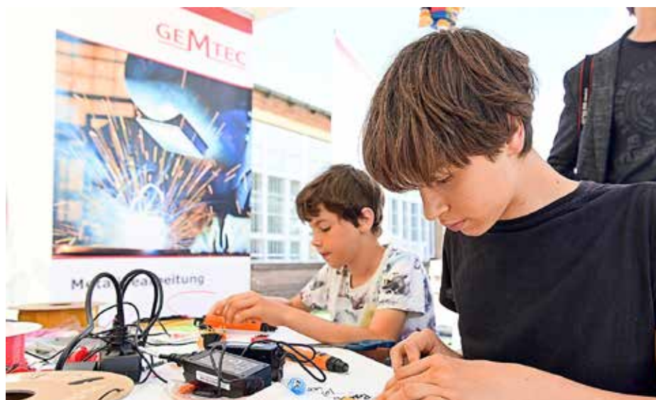
Interessierte können bei der Innovation auch selbst experimentieren.