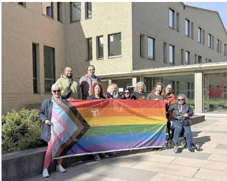
Die Regenbogenfahne ist ein Zeichen für Vielfalt in der Gesellschaft.

„Es sind die Unterschiede, die uns ausmachen. Diese Unterschiede zuzulassen, auszuhalten und zu akzeptieren, sind die Herausforderungen, vor denen wir stehen“, sagte sie in einer kurzen Rede, während die Flagge nach oben gezogen wurde.