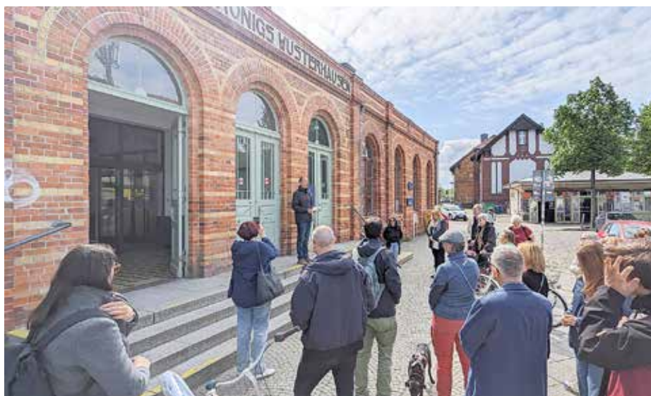
Die erste Station beim Stadtrundgang war der Bahnhofsvorplatz.