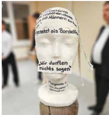
Die Ausstellung rief durch Originalzitate die Erlebnisse und Erfahrungen der Opfer in Erinnerung.

Täterperspektive machte der Abend deutlich, wie schnell Weghören, Wegsehen sowie Sprachlosigkeit die Masse so ergreifen kann, dass der Schritt zum Täter wie selbstverständlich erscheint.“ Auch andere Teilnehmende zeigten sich von der Darbietung der Gesamtschülerinnen und -schüler der Sekundarstufe II ergriffen und lobten die tiefgehende Bearbeitung des Themas. Diese Gedenkveranstaltung anlässlich des Tages zum Gedenken an die Opfer des Nationalsozialismus in Königs Wusterhausen bleibt in Erinnerung – und zwar nicht nur im Kopf, sondern auch im Herzen.