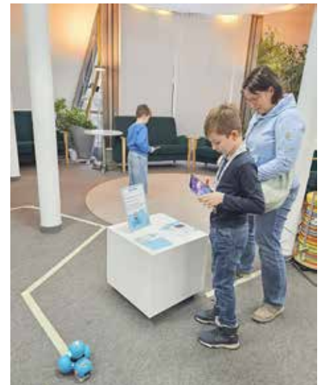
Mit einem Tablet lässt sich der Dash-Roboter sogar von Kindern programmieren und steuern.