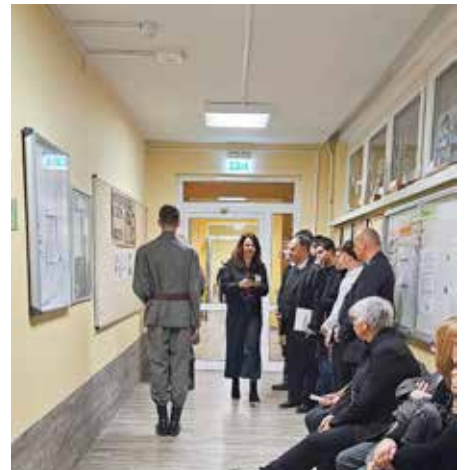
Kurze Spielszenen bezogen auch die Zuschauer ein und stellten sie vor die Frage: Wie würde ich mich verhalten?