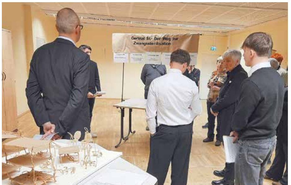
Die Schülerinnen und Schüler der Gesamtschule Otto Lilienthal haben sich anlässlich des Tages zum Gedenken an die Opfer des Nationalsozialismus mit der Perspektive der Opfer und Täter auseinandergesetzt.