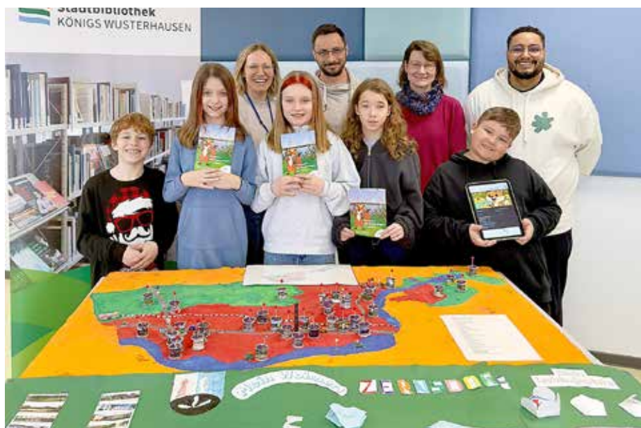
Gemeinsam haben Hortkinder, Hortleitung und die Stadtbibliothek Königs Wusterhausen das Projekt „Zernsdorf aus Kinderaugen“ umgesetzt. Finanzielle Unterstützung gab es von der Bürgerstiftung.

In der Projektwoche konnten die Kinder dann diejenigen Räume und Orte auswählen, die für sie selbst wichtig sind. So finden sich in dem Flyer Sport- und Spielplätze genauso wie der Dönerladen, die Pizzeria und der