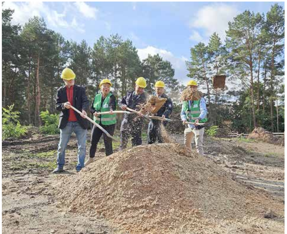
Der offizielle Spatenstich im September vergangenen Jahres markierte den Baustart für den Neubau des Feuerwehrgerätehauses in Wernsdorf.

findet bereits in Zeesen, Zernsdorf und Senzig statt.