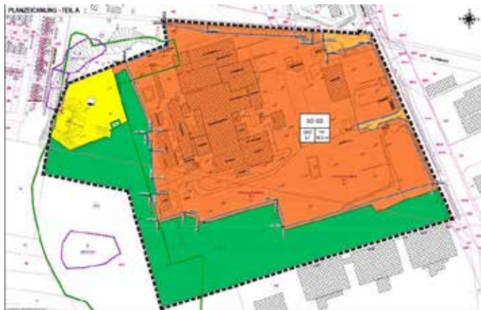
Abbildung: Auszug Planzeichnung