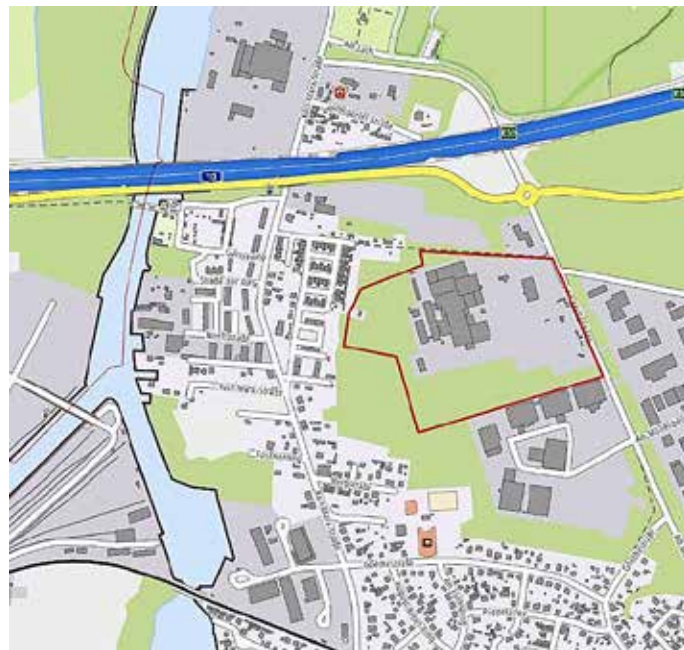
Abbildung: Räumlicher Geltungsbereich des Bebauungsplans „Geflügelschlachthof Niederlehme“ im Ortsteil Niederlehme der Stadt Königs Wusterhausen, Daten- und Kartengrundlage

Die Abgrenzung des räumlichen Geltungsbereiches für den Bebauungsplan „Geflügelschlachthof Niederlehme“ ist der folgenden Abbildung zu entnehmen.