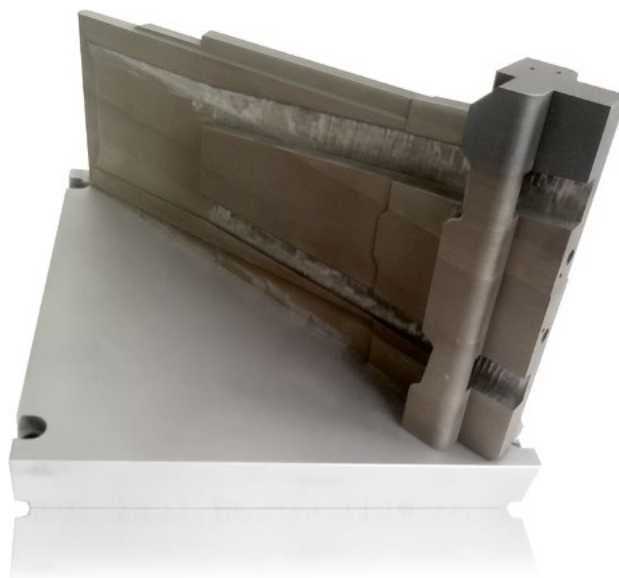
Additiv gefertigtes Werkzeug auf Bauplattform: Die Verwendung der EOS-Technologie trug zu einem längeren Wartungsintervall bei und löste das Problem mit der Luftfeuchtigkeit und der dadurch beschleunigten Korrosion vollständig (Quelle: Innomia).

stellungszyklus: Je schneller die Wärme abtransportiert wird, desto eher kann ein Teil entnommen und das nächste produziert werden. Im bisher verwendeten, aus einer Kupfer-Beryllium-Legierung mit hoher Wärmeleitfähigkeit hergestellten Werkzeug war die Kühlung nur von einer Seite möglich. Die Temperaturverteilung war daher ungleichmäßig. Das verwendete Kühlwasser musste mit nur 16 °C sehr kalt sein, um entsprechend viel Wärmeenergie zu absorbieren. Durch die hohen Temperaturen an der Oberfläche des Einsatzes – bis